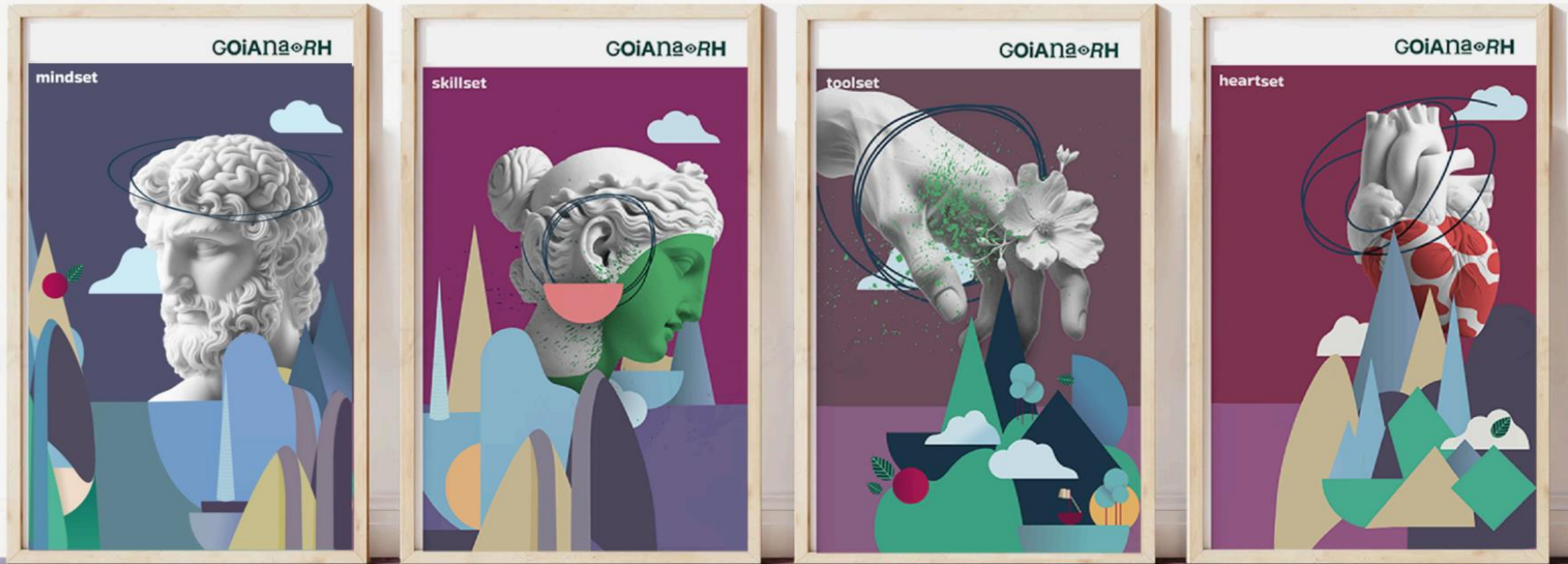
O Pensar Estratégico do RH

O equilíbrio entre estratégia, competências, tecnologias e cuidado é o que se esculpe neste ser completo, complexo e, portanto, plural!